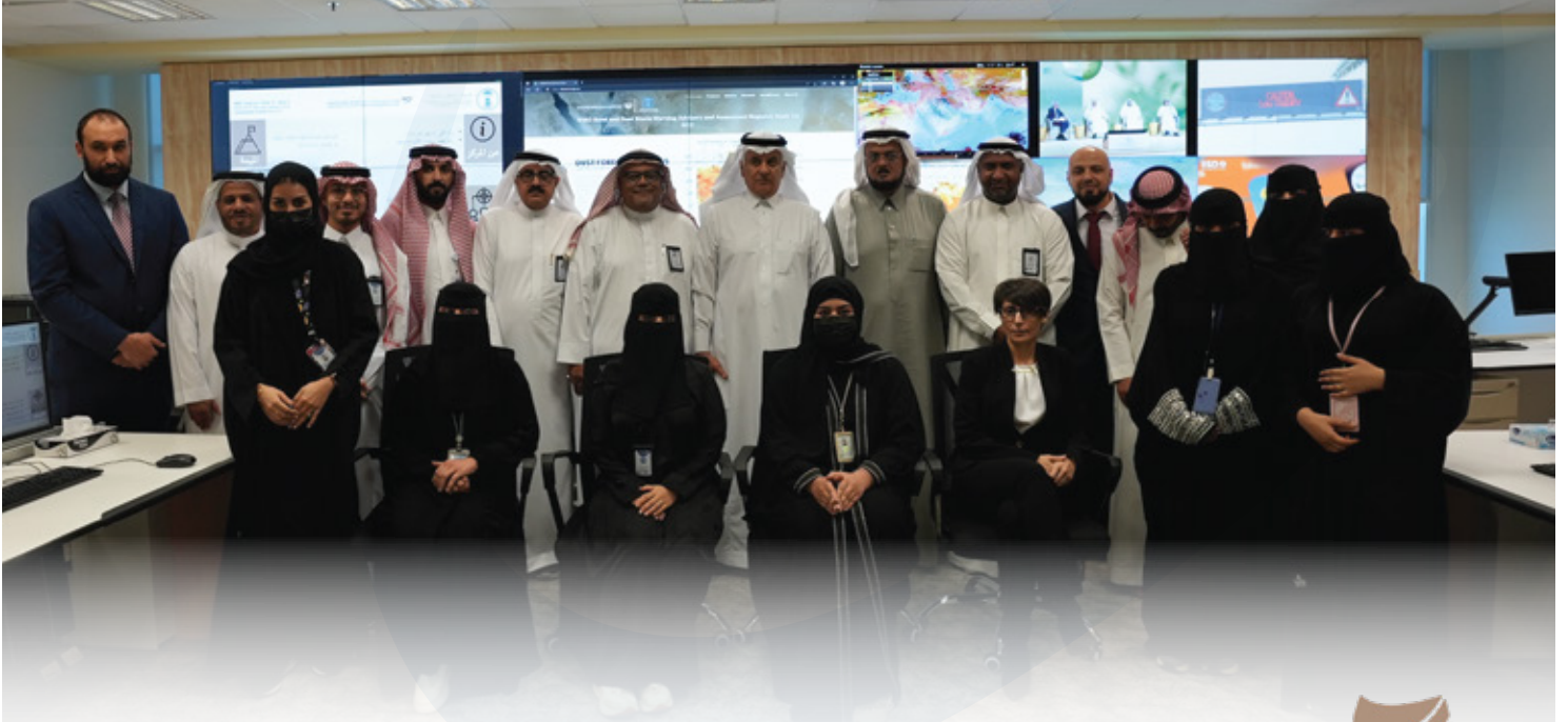
المركز الإقليمي للتحذير من العواصف الغبارية والرملية Sand and Dust Storm Warning Regional Center